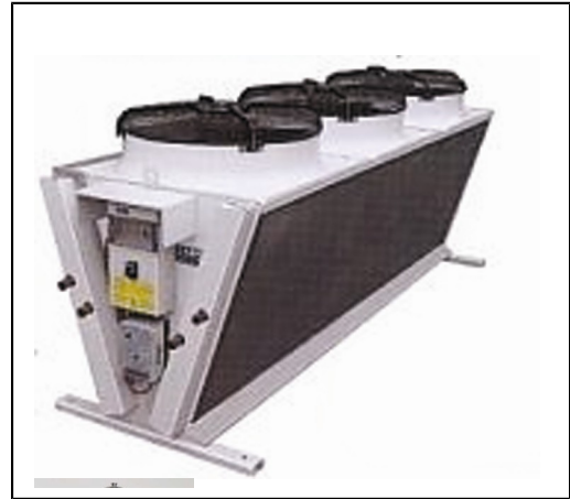
Aerorefrigerador en V