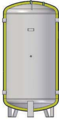
HASTA 500 LITROS UP TO 500 LITRES