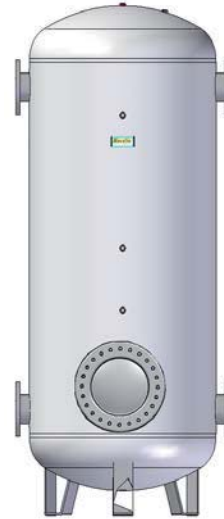
DE 5.000 A 10.000 LITROS FROM 5,000 TO 10,000 LITRES