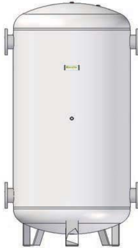
DE 750 A 5.000 LITROS FROM 750 TO 5,000 LITRES